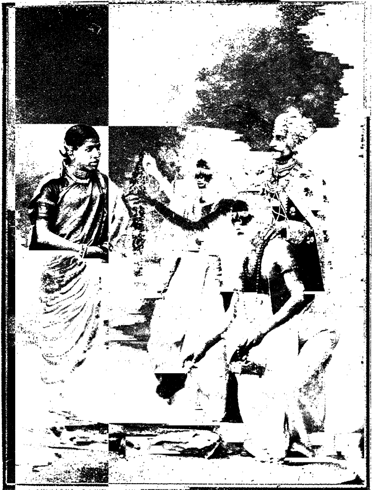
गंधर्वः—यक्षद्वीपाच्या देवीची पूजा तर झालीच.